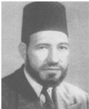
الشيخ حسن البنا مؤسس الإخوان المسلمين